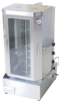
Рис.1 Гриль роликовый СУ-70А .

Модельный ряд так же представлен аппаратами оборудованными створками (стеклянными дверцами). Они предназначены для сохранения температуры в камере с вращающимся вертелом, а также предотвращения попадания инородных предметов и грязи на продукты во время их приготовления. В данном случае в наименование оборудования ставится буквенное обозначение данной модификации. Например, Гриль роликовый СУ-70А . На дверце установлен термометр.